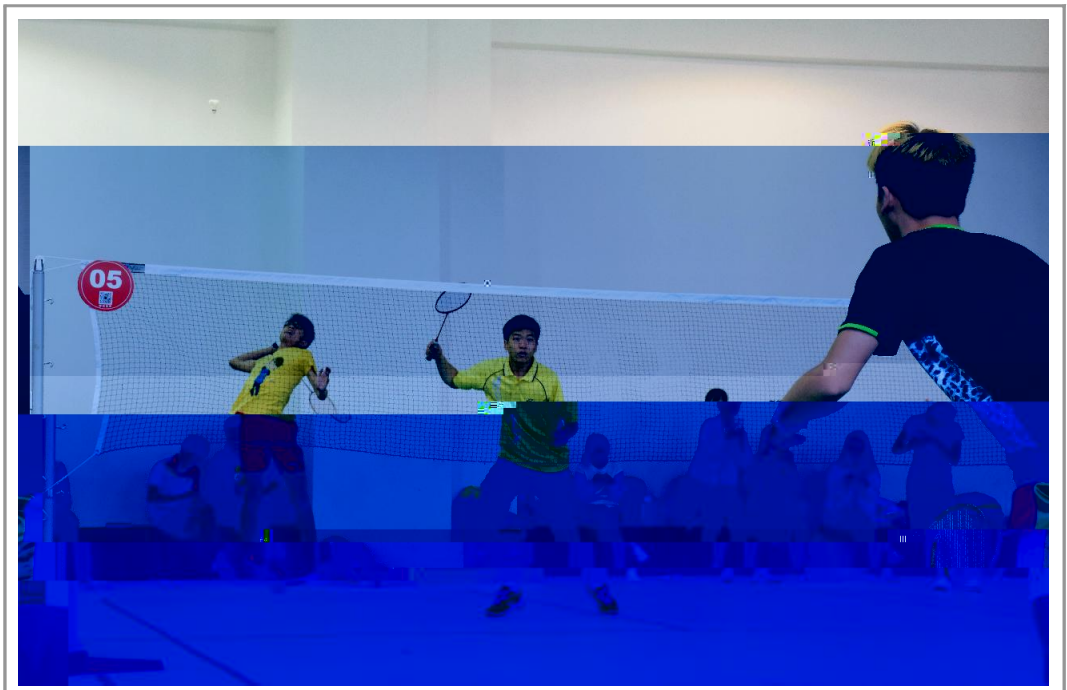
4- 8. /2017Q 232456 789: ; ; <=>?@ABCD= EFGHI /J KD= LM$ NOPQR9: STPQU 122VSWXYZ[ \V] ^ _` aBbcdef ghij kl m>nopL qr EFst luvEFstwxryEUz{ R| } ~* a