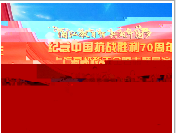
我校教工合唱团参加了上海市教育工会举办的上海高校纪念抗战胜利七十周年教工合唱交流展演

(通讯员 饶婷) 6 1 上海应 技 * 悦4> . 牵# 7 圆 =m] 赠 ' (在贵州 黔 南州天 县 盆 小 ' (上 盆 小 ) 师 感| 悦牵 志 者们的 爱心与付 =m得" 天 县 / 台 黔 南 / 台 家媒体的 者跟踪$道 悦牵 e益l m. 为 圆 =m 为 ": 的线上和线 宣? =m$名 _ 150 余 筛 120名志 者与盆 小 120名小朋 友 . tu 120名志 者kl v 的 it 小朋友们实: 7 儿童 想 悦牵 e益l m. y ^ Nq 100 余件体 Nm器 赠%盆 小 =m^u ^ 13000 F ^ - 230 件 悦牵 e益l m. . 2014 与盆 小 t 每 儿童 . 会 圆 =m 至c 成功 tu 150名贫 儿童圆 们y t. 为v 小 立u 籍阅览O 悦牵 的志 者们 . m 为3 >的 尽绵 i 同/+)" 大 于u 爱 的精. 发 ; 大