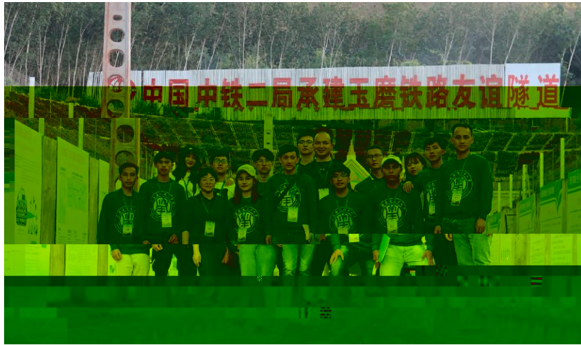
100 60 ASciT)