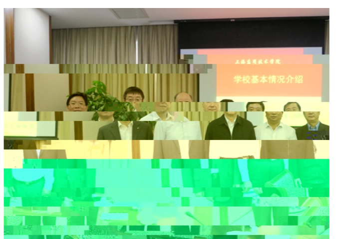
学校基本情况介绍

2013 10月15日 # 237 $ %&' ( ) * +CN31-0826(G) . - . / O 1 2 3 4 5 6 7